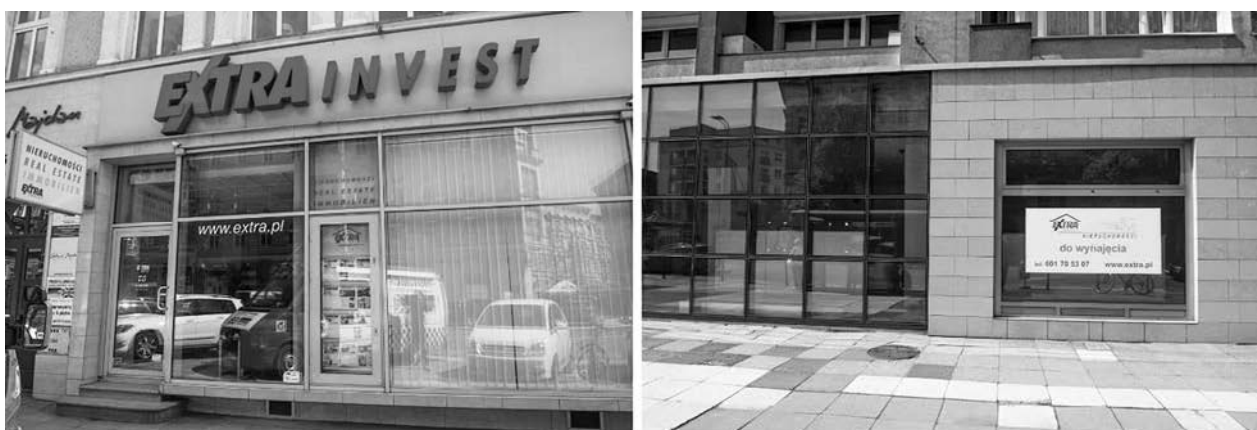
Fig. 8. Left: Real estate office on Wojska Polskiego Avenue providing rental and sale services. Right: One of numerous business in the real estate company's offer.

The demand for rental and selling of the businesses was so great that one of the real estate companies opened their office there to provide the services (Fig. 8).