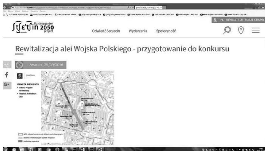
Fig. 10. City website containing the information about tender on revitalization of Wojska Polskiego Avenue.

It is not surprising that most of the citizens of Szczecin chooses the shopping centers, especially when the weather is bad. The city administration has finally noticed the issue. There is an idea to restore, at least partially, the greatness of the Avenue. The preparations for tender on revitalization of the Wojska Polskiego Avenue has already been launched (Fig. 10, 11).