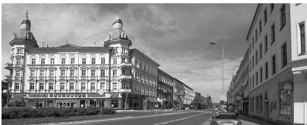
Fig. 5. View on Wojska Polskiego Avenue from Zwycięstwa Square, 2017. Source: photo by Waldemar Marzęcki

http://www.szczecin.fotopolska.euSzczecinu115240,al_Wojska_Polskiego.htmlf=95321-foto1969