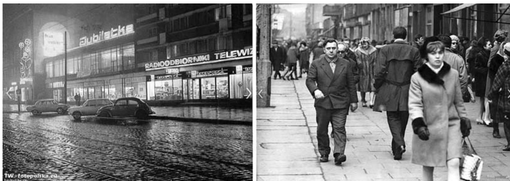
Fig. 4. View of Wojska Polskiego Avenue, 1965–70.