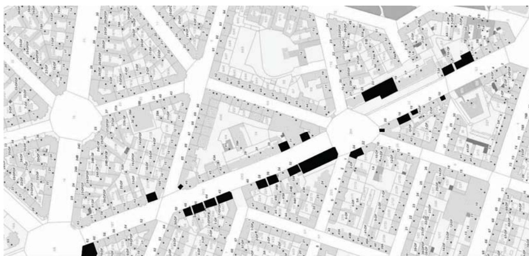
Fig. 6. Wojska Polskiego Avenue. Black spots mark shops for rent or sale.

After the political transformation in 1990, Poland started to undergo dynamic changes. The shops on Wojska Polskiego Avenue were overflowed with western merchandise. On a long run however, the political transformation meant a death to the shops. Suddenly the Wojska Polskiego Avenue started to die slowly. One shop after another was being closed. Only “For Rent” and “For Sale” signs decorated the windows of the shops. The approximate number of closed shops on the Wojska Polskiego Avenue was made (as of 20.06.2017) and is presented on the photos below (Fig. 6, 7):