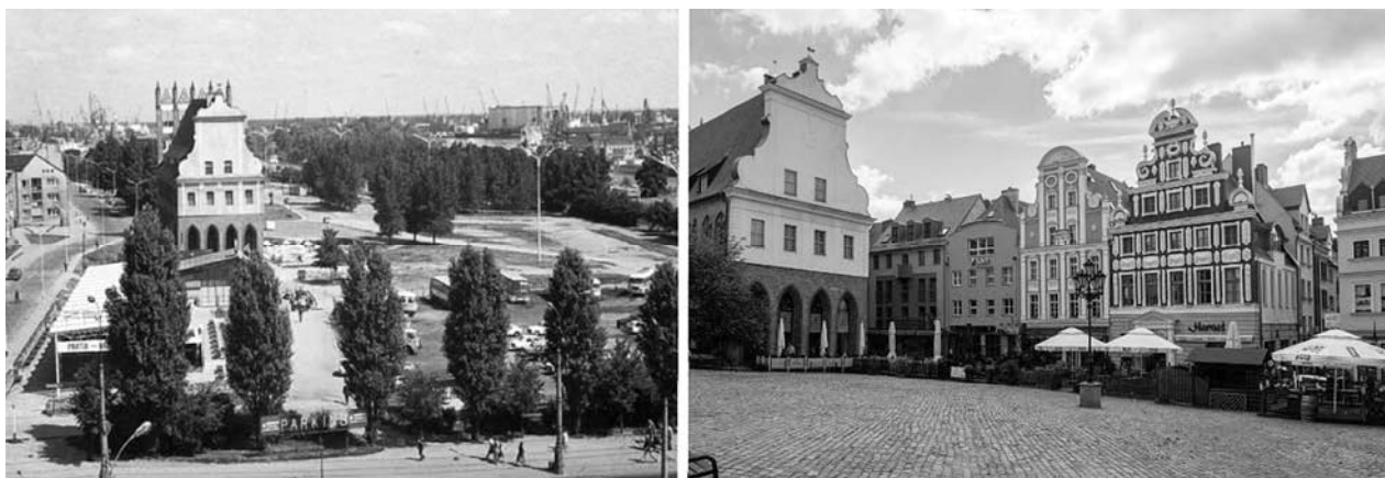
Fig. 2. Left: Development condition of the Castle borough in the '80s. Right: Rynek Sienny (Haymarket), 2017.

The issue of bombardment of the Old Town is especially important for the topic of this paper. After the War, the Old Town buildings were not reconstructed. The renovations included only a small number of surviving historical constructions, and among them the Pomeranian Dukes' Castle had a top priority. Consecutively, renaissance Loitz House and Old City Hall were renovated. The rest of the Old Town was only cleaned from the rubble and left for decades without any intervention. The upper part of the Old Town started being developed in the 1960s. The apartment housing complex was build up there. Fortunately, due to financial problems the plans for constructing four high rise buildings in the close neighborhood of the Old City Hall were dropped. Only in 1994 the development of the lower parts of the Old Town, considered as a Castle borough, started to unfold. The implementation of this construction project agreed with the compliance to historical spatial arrangement of this part of the city (Fig. 2, 3).