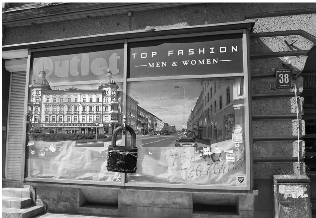
Fig. 11. Photomontage dedicated to dying of the Wojska Polskiego Avenue.

But is it really possible? Can we repair the damage done not only to Wojska Polskiego Avenue but also the whole neighbourhood shopping area in Szczecin that was destroyed by the unfavourable location of big shopping centres in the very heart of the city?