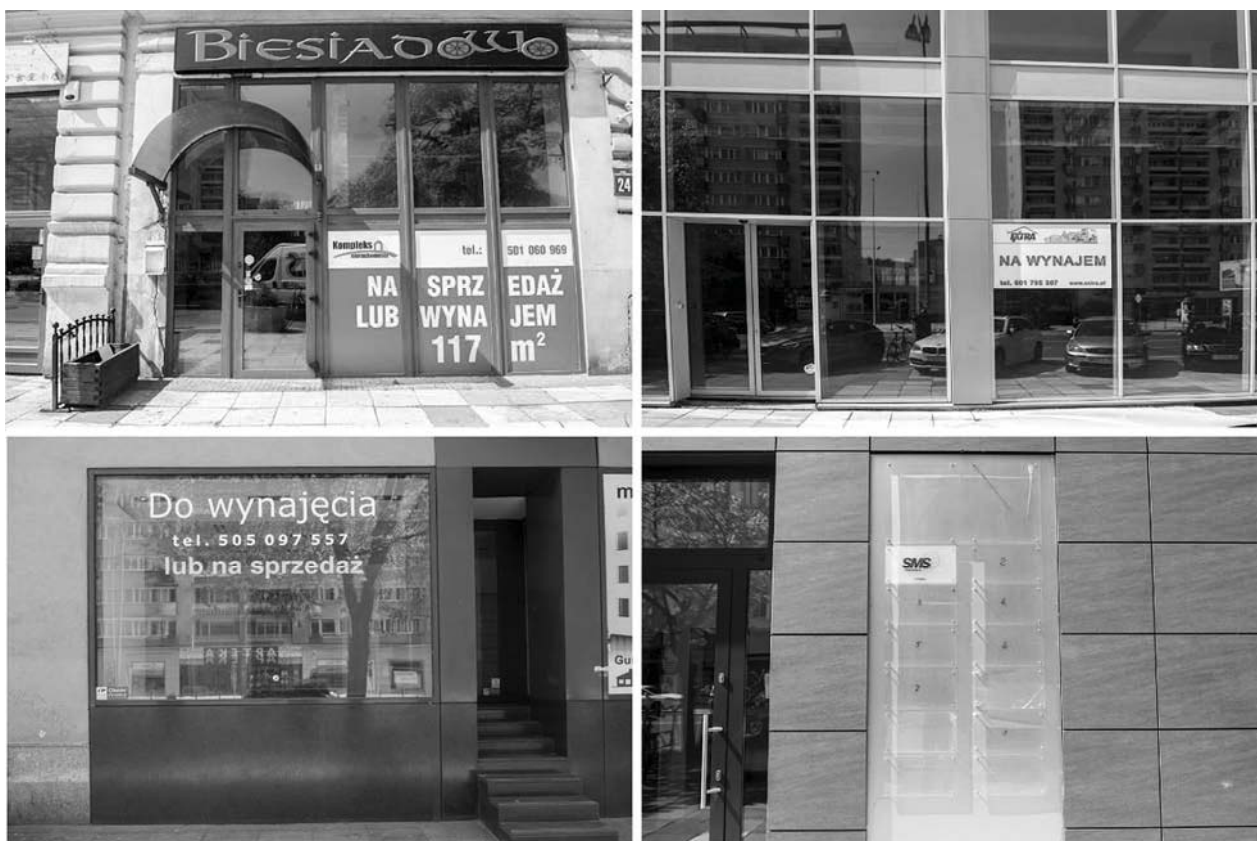
Fig. 7. Examples of business premises for sale or rent.

The demand for rental and selling of the businesses was so great that one of the real estate companies opened their office there to provide the services (Fig. 8).