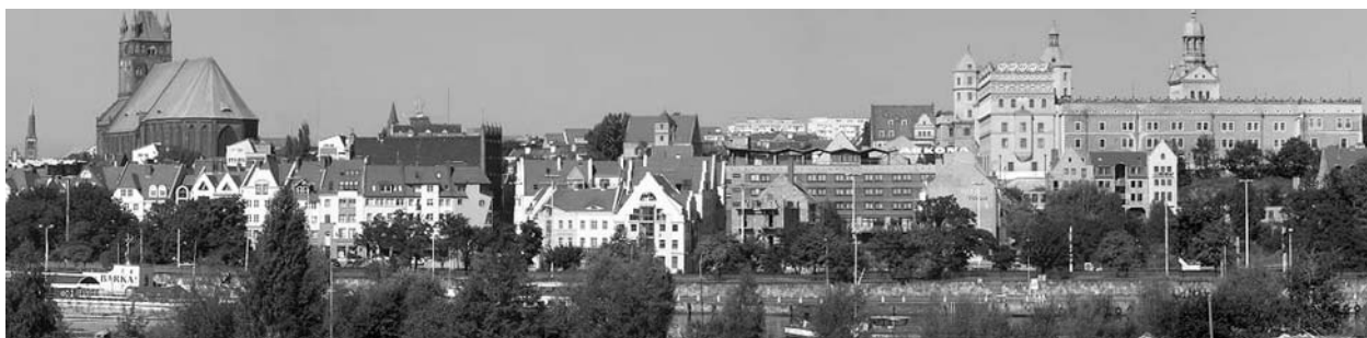
Fig. 3. Panoramic view on developing borough in Szczecin.

The area of the Old Town is mostly filled with modern buildings inspired by historical developments. As opposed to previously mentioned developments in the upper part of the Old Town, the lower part is mostly developed in a close compliance to the former old-town arrangement. A part of the Old Town was however set for infrastructure investments. Most of the free spaces of the Old Town and Rynek Sienny (Haymarket) are nowadays developed. The residents of Szczecin are more and more aware of this place. For almost 49 years Szczecin was deprived of its historical heart. This influenced the behavior and perception of the citizens. The lack of the Old Town resulted in a creation of a different center located along the Wojska Polskiego Avenue. The part of the longest street in Szczecin, between the Szarych Szeregów Square and Zwycięstwa Square, started to be the meeting place thanks to existence of the exclusive boutiques, restaurants and coffee shops. Taking a walk on Wojska Polskiego Avenue was viewed as a good taste (Fig. 4, 5).