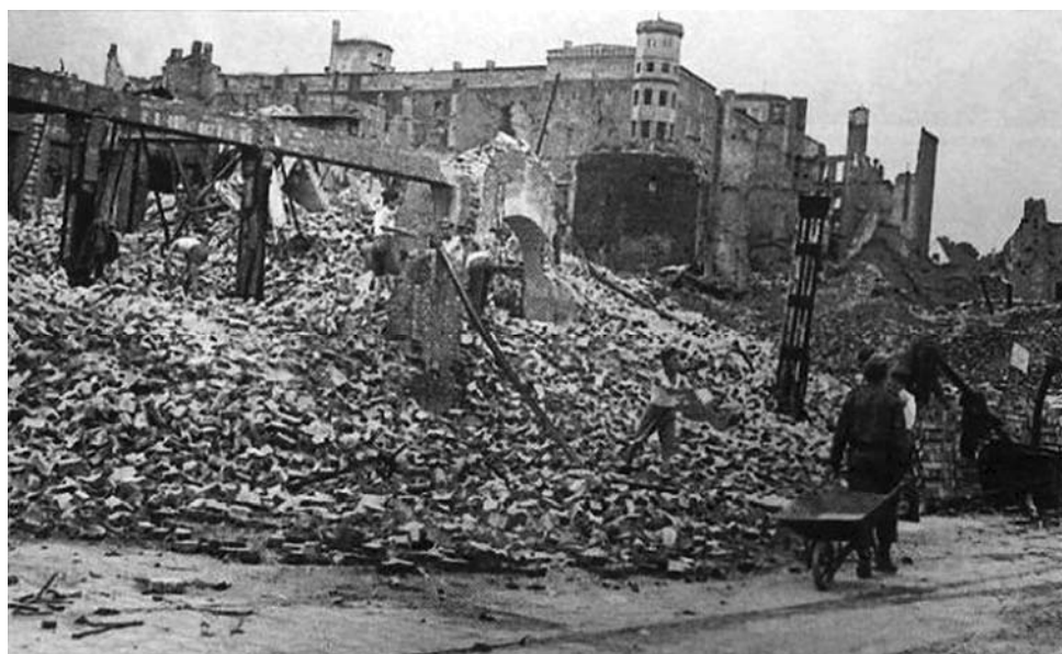
Fig. 1. A view on a bombed Castle borough. In the back Pomeranian Dukes’ Castle in Szczecin.

Szczecin during the Second World War was a target of intense Allies bombardments. As an important industrial center, especially considering the existing harbour, it was particularly exposed to attacks. As a result, majority of the city infrastructure was destroyed, including almost 90 % of the Old Town (Fig. 1).