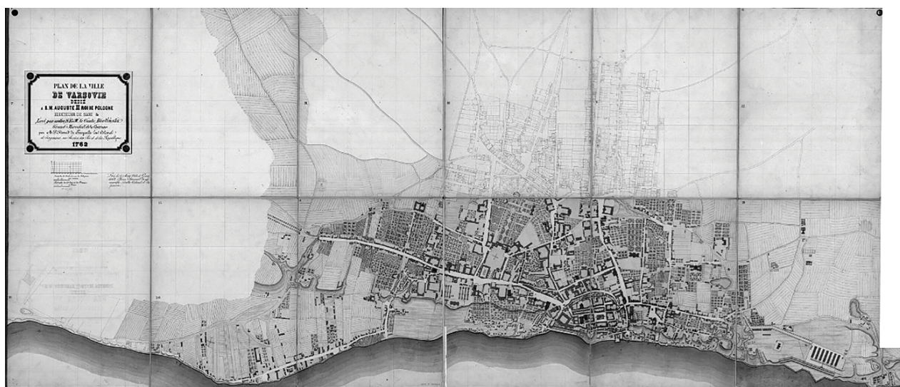
Fig. 2. The Warsaw plan drawn up by architect Pierre Rico de Tiregail. 1761

At the end of 1760 Pierre Rico de Tiregail and his family return to Warsaw. At the request of Czech crown marshal Francis Belynsky, who headed the road commission (Komisja Brukowa) founded by King Augustus III, he takes on the ambitious task of drawing up a detailed plan of the city of Warsaw, which eventually brought him fame. On eighteen parts on a scale of about 1:1000, he makes a plan of Warsaw with its suburbs probably based on the measurements of the architect Jakub Fontan (Fig. 2). Pierre Rico de Tiregail completed work on the plan on May 1, 1761, receiving a reward of 2,533.1 zlotys. At the request of F. Belynsky, Pierre Rico de Tiregail is preparing a plan of Warsaw for printing, reducing it to a scale of 1:6690. Under the plan, the architect places a panorama of the city of Warsaw from the Visla River; on top and both sides there are seventeen impressive buildings, mainly palaces – royal and senatorial. After the Second World War, these images became a valuable source for the reconstruction of palaces.